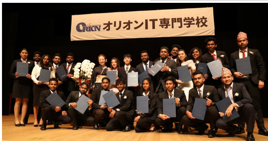
【3月】卒業式・春季休暇