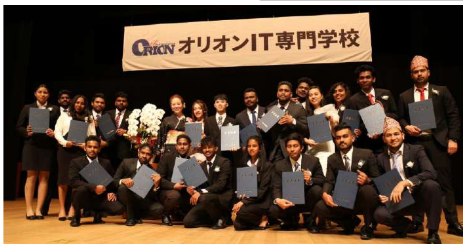
【3月】卒業式・春季休暇